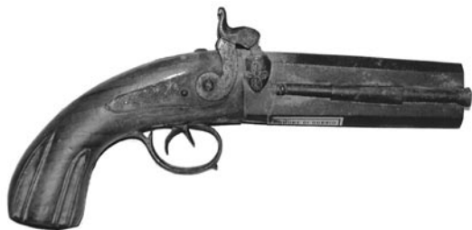
Pistola tascabile a percussione ad avancarica, prima metà del XIX sec.