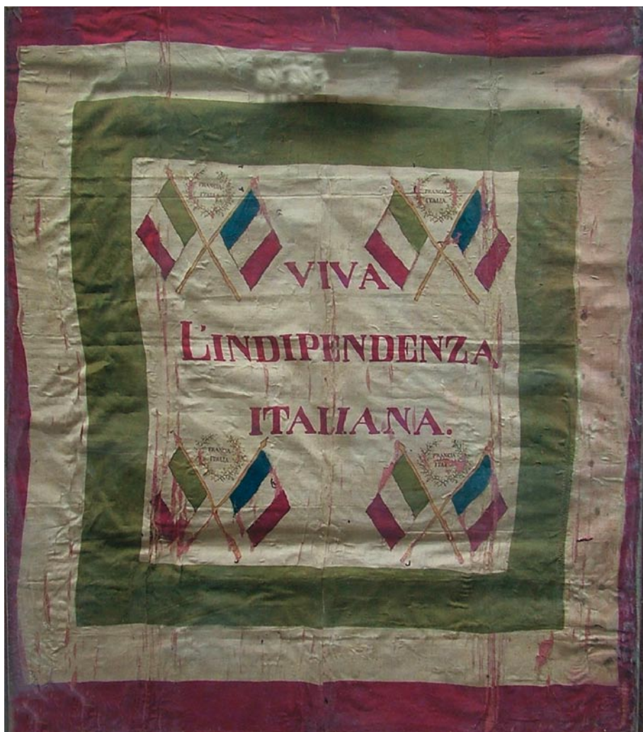
Bandiera inneggiante all'indipendenza italiana, 1859 ca. Gubbio, depositi del museo civico.