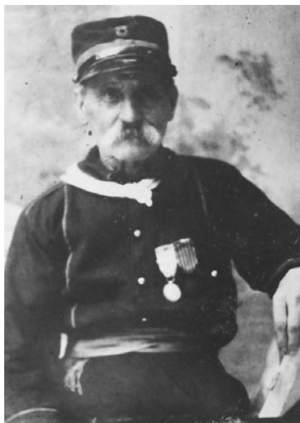
Luigi Mazzacrelli, volontario garibaldino a Mentana nel 1867.

SASG, Archivio storico del Comune di Gubbio, Museo del Risorgimento , b. 3.