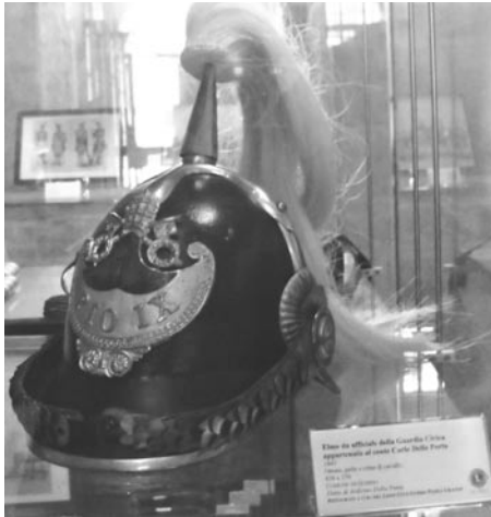
Elmo da ufficiale della Guardia Civica, 1847. Gubbio, Sezione risorgimentale del museo civico.

giocata una partita fondamentale per le sorti dell'Italia.